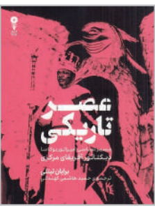
بوکاسا؛ امپراتور خون آشام آفریقا.

این نویسنده درباره قدرت خرید مردم در تهیه این کتاب برای کودکان، بیان کرد: این اثر فرهنگی است و خانواده‌ها برای خوردن و خوشگذرانی پول خرج می‌کنند، عموم مردم نمی‌توانند کتاب را تهیه کنند اما می‌توان از سود این کتاب کارهای خیر انجام داد.