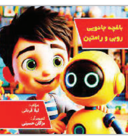
این کتاب آموزش هوش مصنوعی است که به صورت داستان نوشته شده و برای کودکان بالای ۳ سال قابل فهم است.