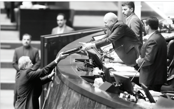
یازنگری جدی است.