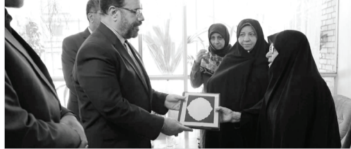
استاندار فارس در این دیدار صمیمانه با اشاره بر اینکه قشمر جوان به

رسیدن به درجه شهادت از الطاف خفیه الهی است