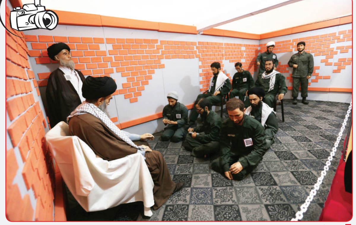
نمایشگاه اقتدار و امنیت

◆ چگونه اختلال امتناع از مدرسه رفتن را رفع کنیم؟ در ابتدای امر موارد ذکر شده در زیر را بررسی کنید: وضعیت فیزیکی و روانی؛ از طریق پزشک یا روانپزشک مطمئن شوید مسأله خاصی وجود ندارد. شرایط دانش‌آموز در مدرسه: مطمئن شوید مثلاً یکی از دانش‌آموزان قلدر کلاس او را آذیت نمی‌کند. وضعیت توانایی‌ها و کسب مهارت‌ها: ممکن است اخیراً اختلالی در کسب مهارت‌ها به وجود آمده باشد که دانش‌آموز از هم کلاسی‌هایش عقب می‌ماند و همین امر او را آزار می‌دهد. با گفت‌وگو و ایجاد رفاقت به فرزندان حسن‌امنیّت بدهید. با فرزندان صحبت کنید، نگرانی‌های او را تأیید کنید، از سخنرانی و نصیحت کردن اجتناب کنید. در مورد چیزی که آنها را آزار می‌دهد صحبت